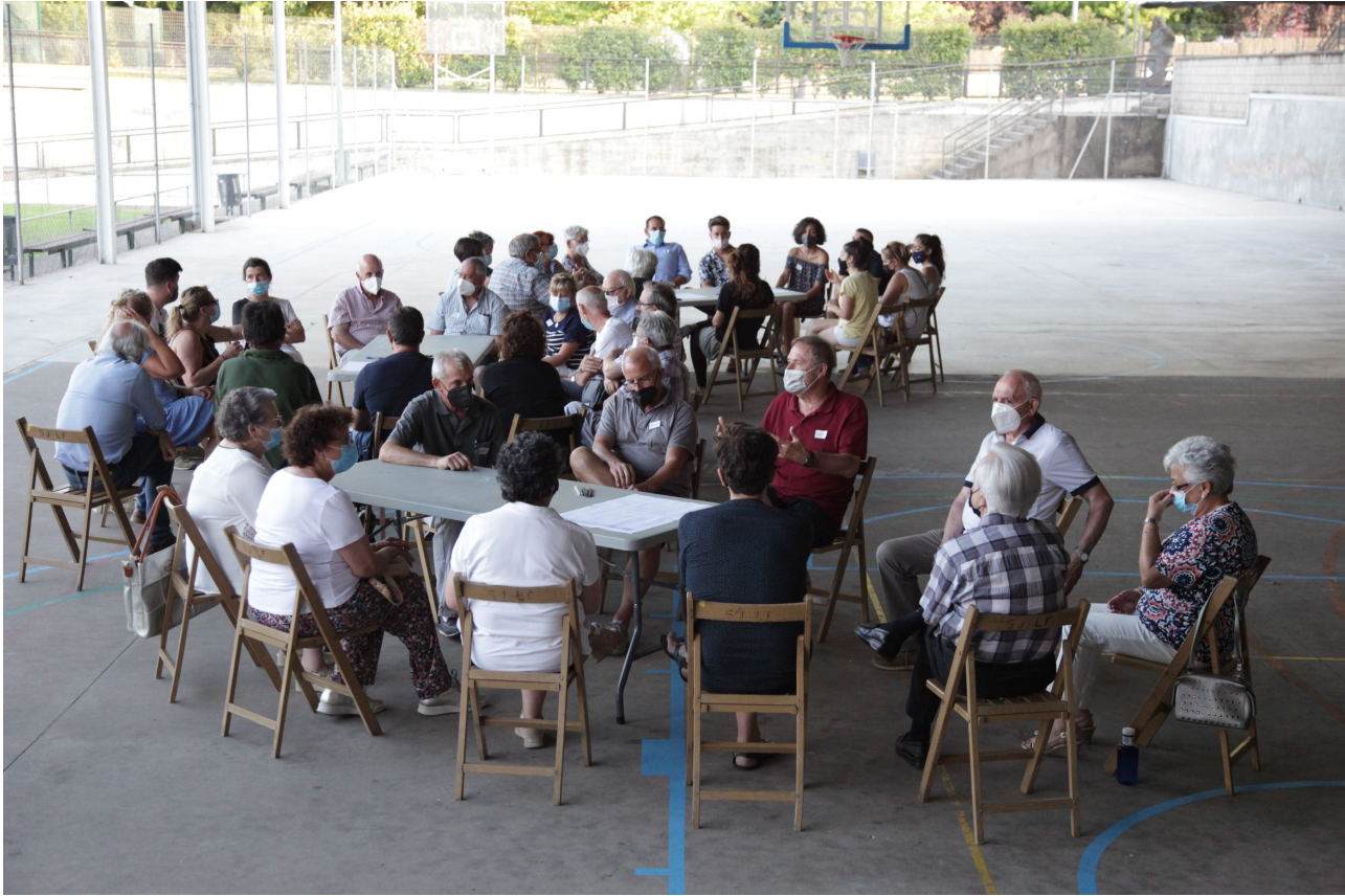
Imatge 02: Treballant en petits grups l'eix 4, sobre Governança