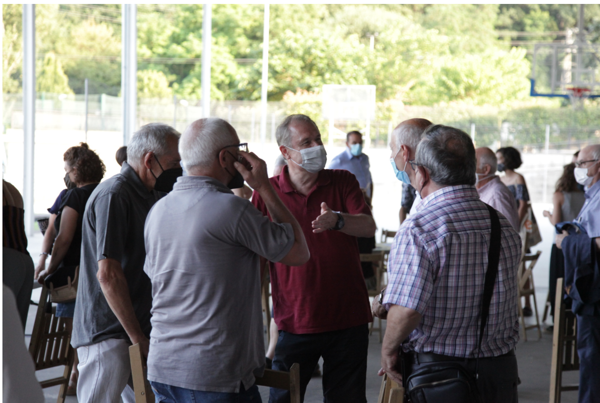
Imatge 01: Persones dialogant durant la sessió participativa

En la redacció d'aquest document, la cooperativa Resilience.Earth utilitza el llenguatge inclusiu, seguint les directrius de l'enfocament basat en el gènere i en els drets humans (EBGiDH). És per aquest motiu que la present memòria s'escriu utilitzant principalment paraules en gènere neutre i parlant de «persones». L'ús del llenguatge inclusiu surt d'un compromís per a contribuir a la construcció de l'equitat de gènere, entre altres equitats 1 .